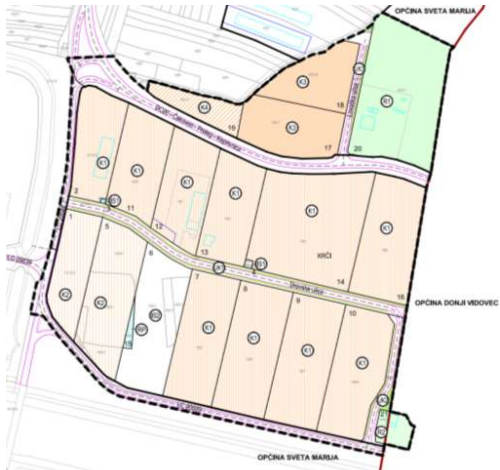
Prikaz 2 Prikaz namjene površina – rješenje prema II. ID DPU – 2021.